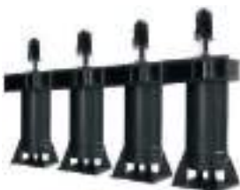
Bombas de Hélice