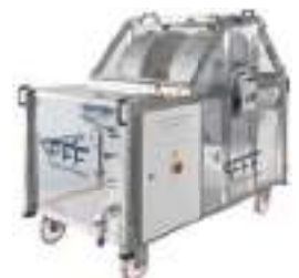
Vacunadores de Inmersión